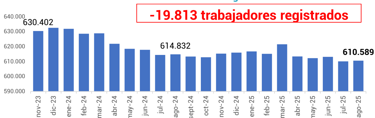
Gráfico 2. Evolución de la cantidad de trabajadores. Período: noviembre 2023 – agosto 2025

Por otro lado, en el mismo período, la cantidad de trabajadores/as registrados/as en unidades productivas se redujo 3,1%, lo que representa una pérdida de 19.813 puestos de trabajo, al pasar de 630.402 en noviembre de 2023 a 610.589 en agosto de 2025.