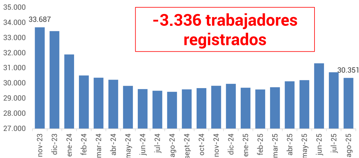
Gráfico 2. Evolución de la cantidad de trabajadores. Período: noviembre 2023 – agosto 2025

Por otro lado, en el mismo período, la cantidad de trabajadores/as registrados/as se redujo 9,9%, lo que representa una pérdida de 3.336 puestos de trabajo, al pasar de 33.687 en noviembre de 2023 a 30.351 en agosto de 2025.