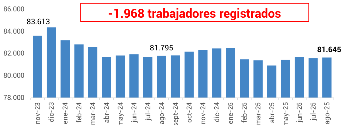
Gráfico 2. Evolución de la cantidad de trabajadores. Período: noviembre 2023 – agosto 2025

En el mismo período, la cantidad de trabajadores/as registrados/as en unidades productivas se redujo 2,4%, lo que representa una pérdida de 1.968 puestos de trabajo, al pasar de 83.613 en noviembre de 2023 a 81.645 en agosto de 2025.