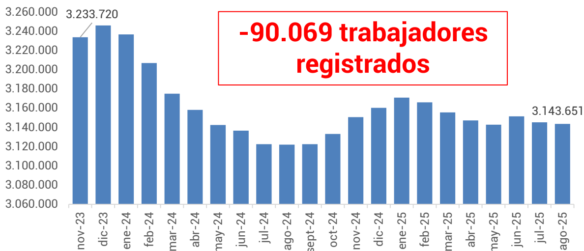
Gráfico 2. Evolución de la cantidad de trabajadores. Período: noviembre 2023 – agosto 2025

Por otro lado, en el mismo período, la cantidad de trabajadores/as registrados/as se redujo 2,8%, lo que representa una pérdida de 90.069 puestos de trabajo, al pasar de 3.233.720 en noviembre de 2023 a 3.143.651 en agosto de 2025.