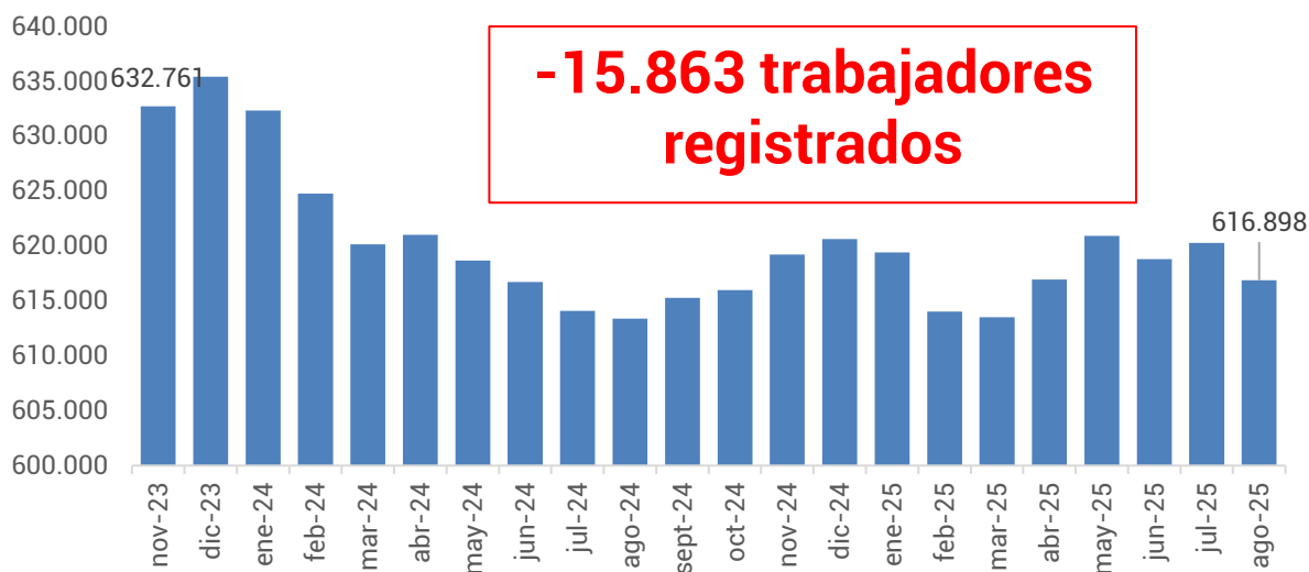
Gráfico 2. Evolución de la cantidad de trabajadores. Período: noviembre 2023 – agosto 2025

Por otro lado, en el mismo período, la cantidad de trabajadores/as registrados/as se redujo 2,5%, lo que representa una pérdida de 15.863 puestos de trabajo, al pasar de 632.761 en noviembre de 2023 a 616.898 en agosto de 2025.