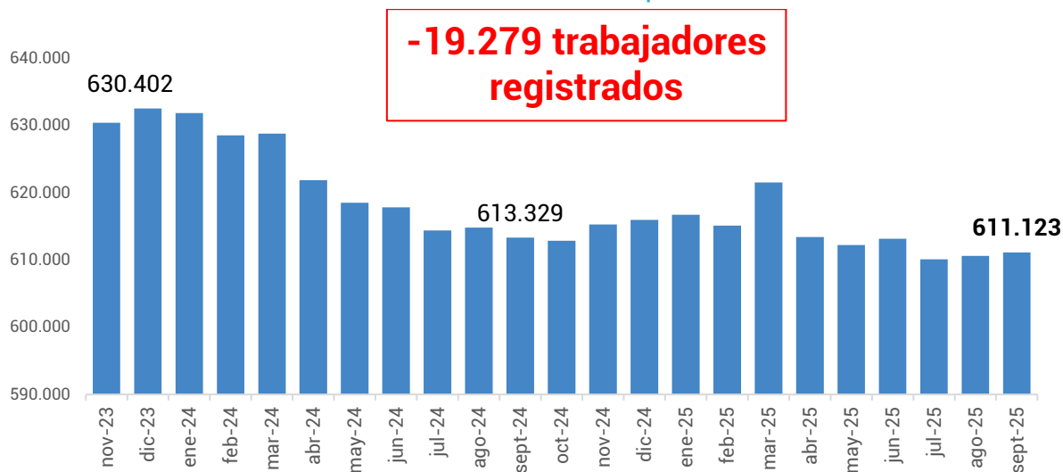
Gráfico 2. Evolución de la cantidad de trabajadores. Período: noviembre 2023 – septiembre 2025