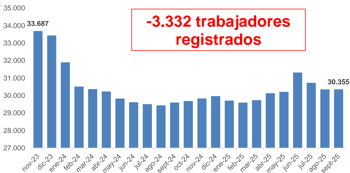
Gráfico 2. Evolución de la cantidad de trabajadores. Período: noviembre 2023 – septiembre 2025

Por otro lado, en el mismo período, la cantidad de trabajadores/as registrados/as se redujo 9,9%, lo que representa una pérdida de 3.332 puestos de trabajo, al pasar de 33.687 en noviembre de 2023 a 30.355 en septiembre de 2025.