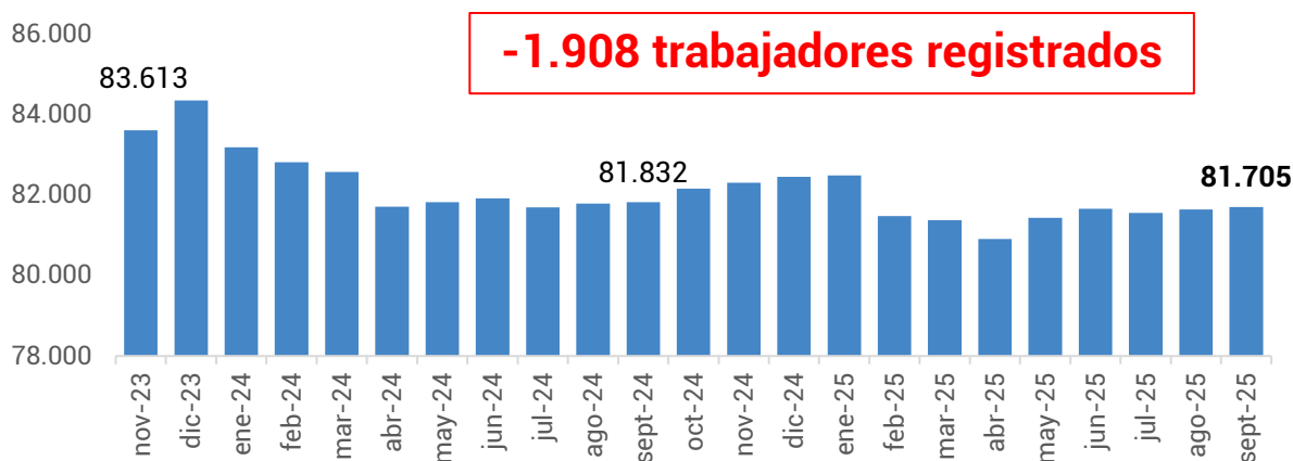
Gráfico 2. Evolución de la cantidad de trabajadores. Período: noviembre 2023 – septiembre 2025

Por otro lado, en el mismo período, la cantidad de trabajadores/as registrados/as en unidades productivas se redujo 2,3%, lo que representa una pérdida de 1.908 puestos de trabajo, al pasar de 83.613 en noviembre de 2023 a 81.705 en septiembre de 2025.