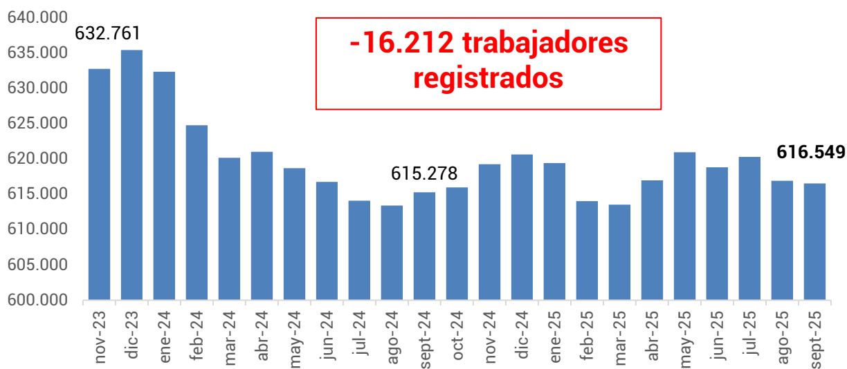
Gráfico 2. Evolución de la cantidad de trabajadores. Período: noviembre 2023 – septiembre 2025