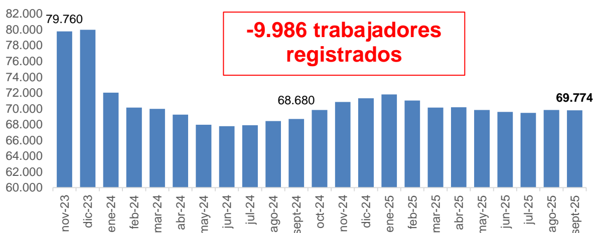
Gráfico 2. Evolución de la cantidad de trabajadores. Período: noviembre 2023 – septiembre 2025

Por otro lado, en el mismo período, la cantidad de trabajadores/as registrados/as se redujo 12,5%, lo que representa una pérdida de 9.986 puestos de trabajo, al pasar de 79.760 en noviembre de 2023 a 69.774 en septiembre de 2025.