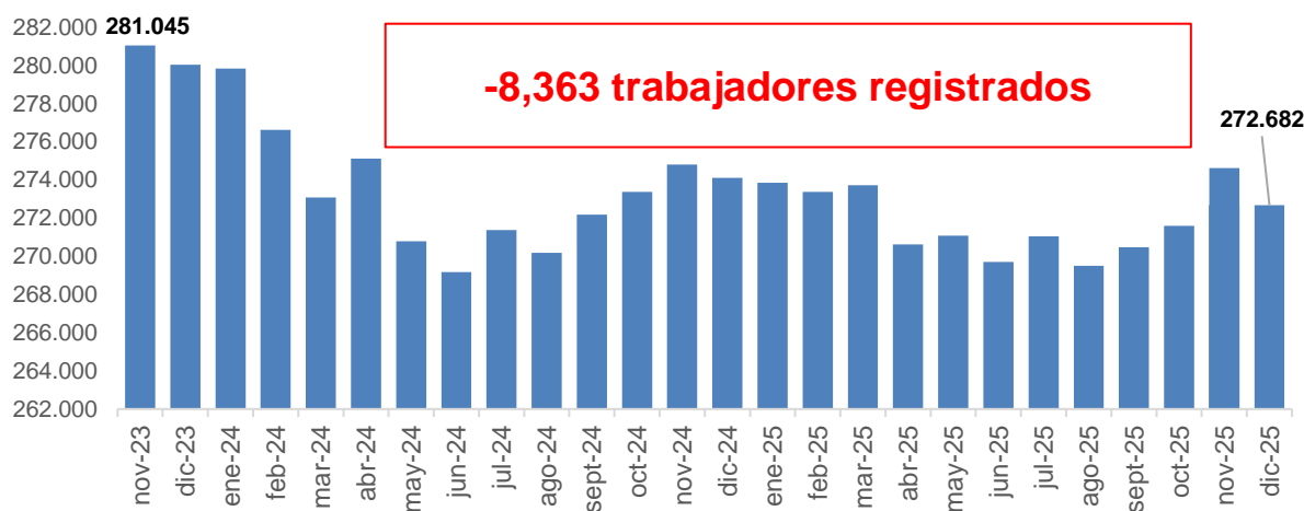
Gráfico 2. Evolución de la cantidad de trabajadores. Período: noviembre 2023 - diciembre 2025

Por otro lado, en el mismo período, la cantidad de trabajadores/as registrados/as se redujo 2,3%, lo que representa una pérdida de 8.363 puestos de trabajo, al pasar de 281.045 en noviembre de 2023 a 272.682 en diciembre de 2025.